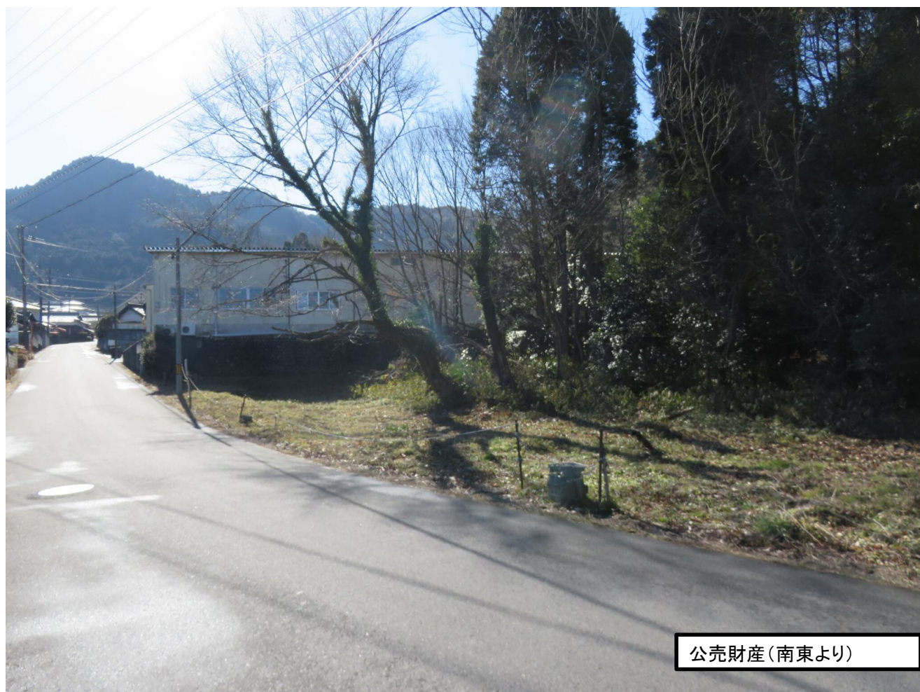
公売財産(南東より)