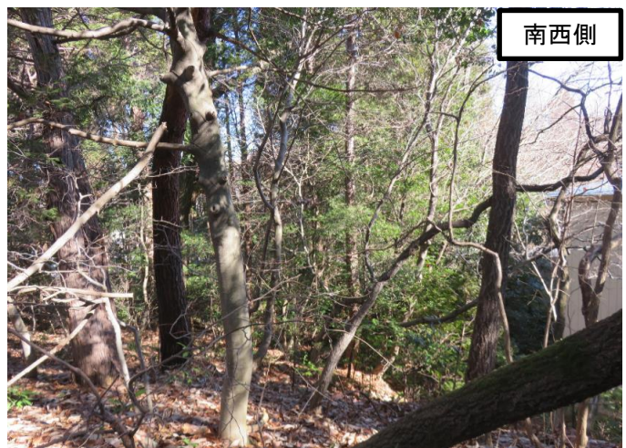
笠原小学校附属幼稚園