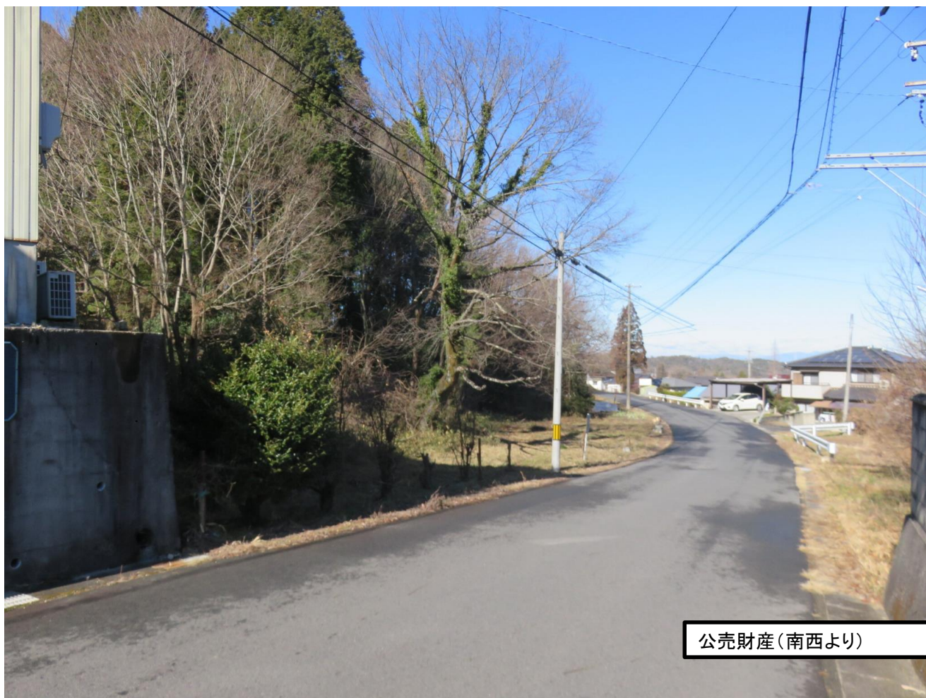
公売財産(南西より)