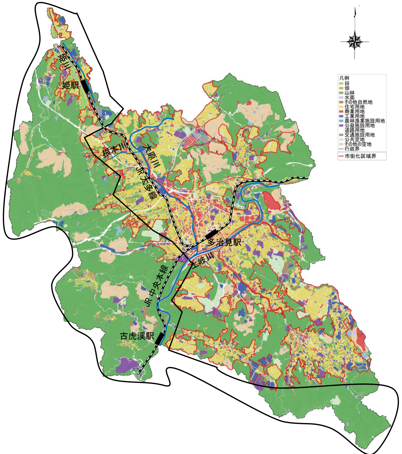
西部・南部丘陵地エリア 土地利用現況図

本エリアは、市域の北西から南東に位置し、大部分が保安林と農業振興地域で構成され、山裾・山あいには集落・住宅団地が位置している、豊かな自然環境が残るエリアです。