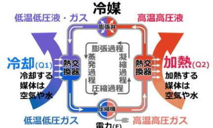
ヒートポンプの仕組み