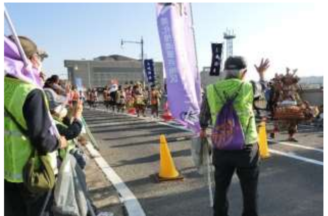
多治見橋 北詰めの様子

午後2時、市役所本庁舎前でパレードの出発式が行われた後、高木市長扮する多治見国長公の“エイエイオー”の掛け声を合図に、鼓笛隊を先