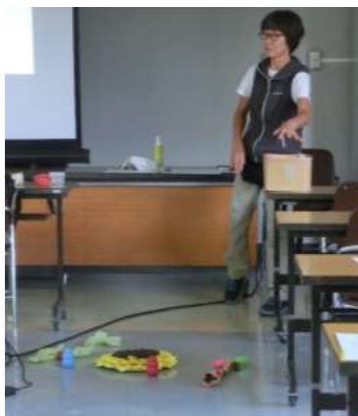
講義の様子（おもちゃの紹介）

をテーマにお話しされ、犬のしつけは「成功」が「成功」のもとと、パワーポイントとDVDの映像を使いながら説明されました。