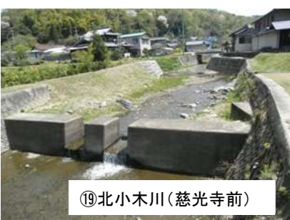
⑲北小木川(慈光寺前)