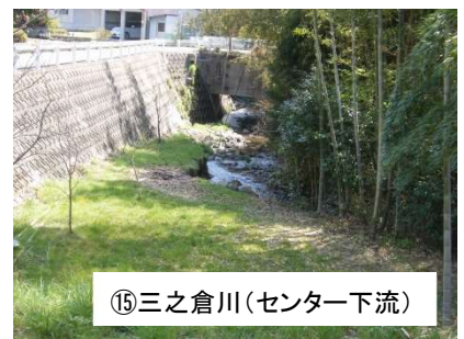
⑮三之倉川(センター下流)