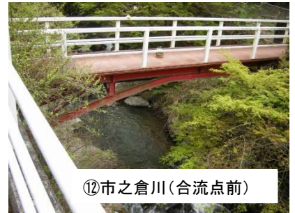
⑫市之倉川(合流点前)