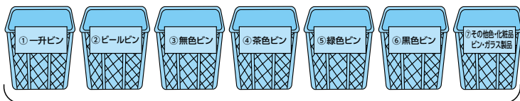
サンテナ(プラスチック製のかご)