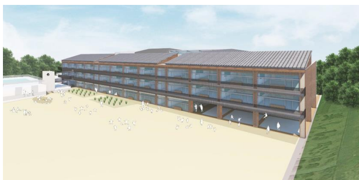
完成イメージ(南東から)