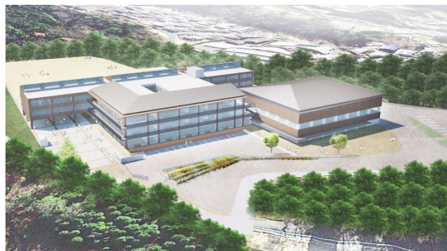
完成イメージ(北東から)

新しい学校は現在の笠原小学校敷地に建設されます。令和5年度は、既設小学校校舎の外壁アスベストの除去、令和6年度から7年度は、既設小学校校舎の解体撤去・新校舎の建設を実施します。