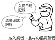
納入業者・食材の品質管理

子どもたちに安全な給食を提供するために、国のガイドラインに沿った衛生管理を行っています。各工程で、決められた内容を実施し、記録しながら作業を行うことで安全性を高めています。