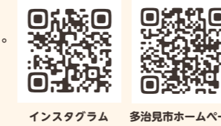
Instagram 多治見市ホームページ