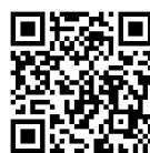
子どもスタッフ紹介動画