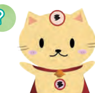
たじみ子ども会議 マスコットキャラクター タジニャン

◆ たじみ子ども会議☆子どもスタッフ会議 ◆ 原則毎月第4日曜日 10：00～12：00 ヤマカまなびパーク 「たじみ子ども会議☆子どもスタッフ」は毎年開催する「たじみ子ども会議」の企画運営・準備から「たじみ子ども会議」でまとめた意見の実現まで幅広く活躍しています。興味のある方はくらし人権課へお問い合わせください。