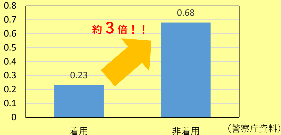
(%) ヘルメット着用状況別の致死率比較（令和2年）