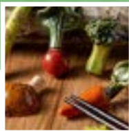
※賞品の写真はイメージです