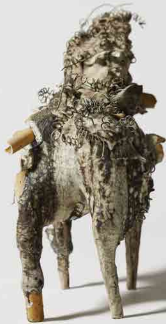
【グランプリ / Grand Prix】 作品名 / Title: Kiln 部 門 / Category: 陶芸部門 Ceramic Arts Category