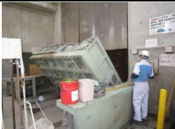
ダンピングボックス