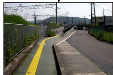
バリアフリー整備工事