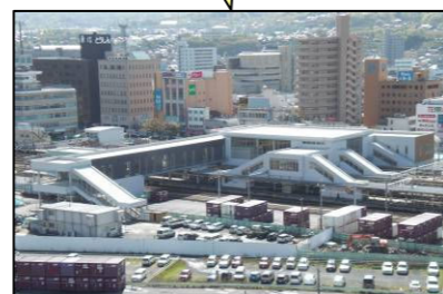
駅舎及び南北通路の整備