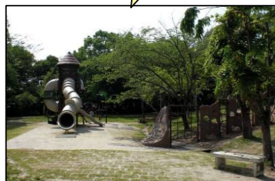
太平公園改修整備