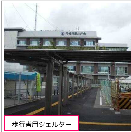
歩行者用シェルター