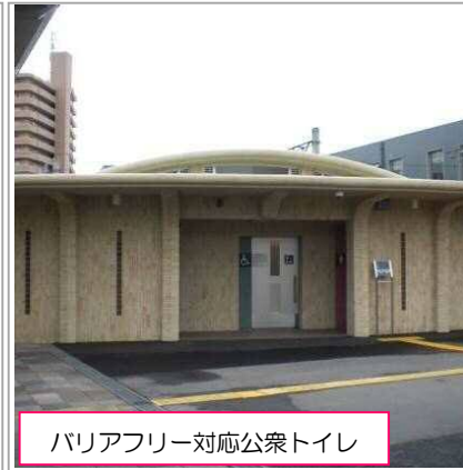
バリアフリー対応公衆トイレ