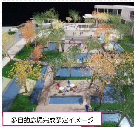
多目的広場完成予定イメージ