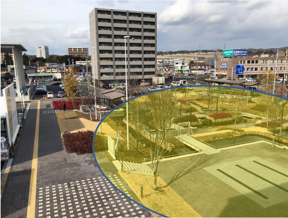
多治見虎溪用水広場