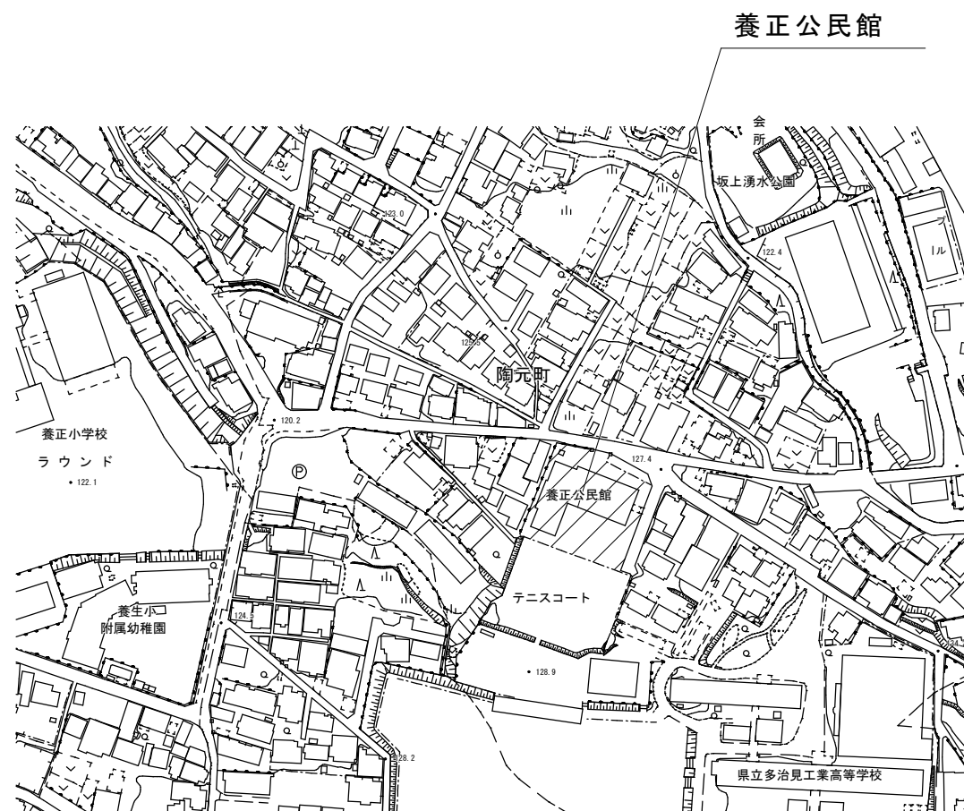
付近見取り図 1 : 3000