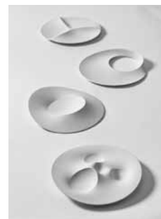
▲柳井友一作 ランドスケープウェア 「landscape ware」