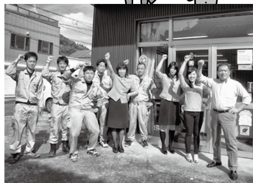
▲参加された林電機商会の皆さん