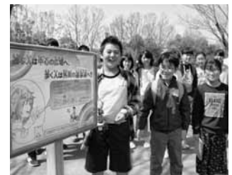
▲昨年度の活動様子(太平公園に子どもスタッフが考えた看板を整備)