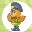
岐阜県警シンボルマスコット らびいくん

— 安子おばあちゃんと全くんの交通安全教室 — 行けるはず まだ渡れるは もう危険