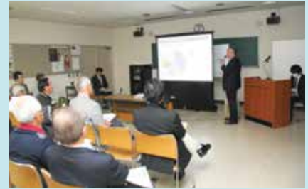
▲市民説明会の様子

市は現在、今回いただいた意見を参考にして公共施設適正配置計画の素案を作成しています。平成30年度には、この素案についてさらに幅広く市民の皆さんと意見を交換する機会を設け、計画を策定していく予定です。