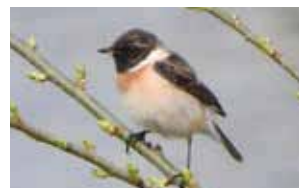
ノビタキ 4月16日撮影

土岐川の桜の木、河川敷の草木などは、長い距離を移動する旅鳥(春の北上や秋の南下の渡りの時期の見られる鳥)にとって貴重な中継地(休息地)です。ノビタキは4月と9月から10月に見られます。4月のオスは繁殖羽、9月から10月のオスは冬羽に変わり、河川敷で昆虫・クモ類などを食べます。ニュウナイスズメは、4月に見られ、昆虫・草木の種子などを食べますが、多治見市では、桜の花の蜜も吸います。オオジュリンは、2月から3月に見られ、ヨシの皮をむいて、中のカイガラムシなどを食べます。土岐川の桜(14本桜)が、堤防かさ上げ工事で少なくなり、近年は、ニュウナイスズメ・コムドリ・エゾビタキ・コサメビタキなどの確認数が減っています。人にとって1本でも、野鳥にとって大きな1本かもしれません。河川敷の草木など増減も同じです。5月10日から16日まで愛鳥週間です。