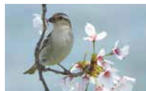
ニュウナイスズメ 4月16日撮影