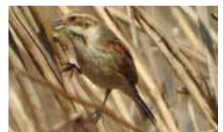
オオジュリン 3月7日撮影

参考文献 フィールドガイド日本の野鳥増補改訂新版 (文責 日本野鳥の会 岐阜 富田増男)