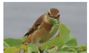
ノビタキ 10月22日撮影