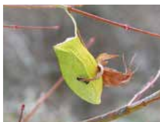
①ウスタビガの抜け繭

ヤマユガ科の幼虫は、6月ごろ蛹になる直前に糸を吐いて繭を作ります。繭の中で蛹の期間を過ごし、成虫になると繭から出て飛び立っていきます。ウスタビガの羽化はちょうど今ごろで、灯火に飛んで来ることもあります。翅両端が10cmほどで、透き通る4つの紋が特徴です(写真②)。