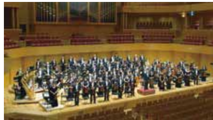
▲名古屋フィルハーモニー交響楽団