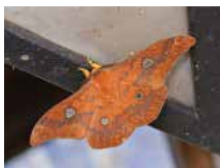
②ウスタビガの成虫

ところでウスタビガの繭は、夏に羽化する他のヤマユガ科の繭に比べてはるかに頑丈です。6月から11月まで長期にわたり日差しや風雨そして捕食者から蛹を守るための工夫でしょう。反面、その頑丈さから成虫は他の種のように繭を破って出ることができません。そのためがまぐちバッグのように上辺が出口として直線状になっています。これが繭の奇妙な形の理由です。