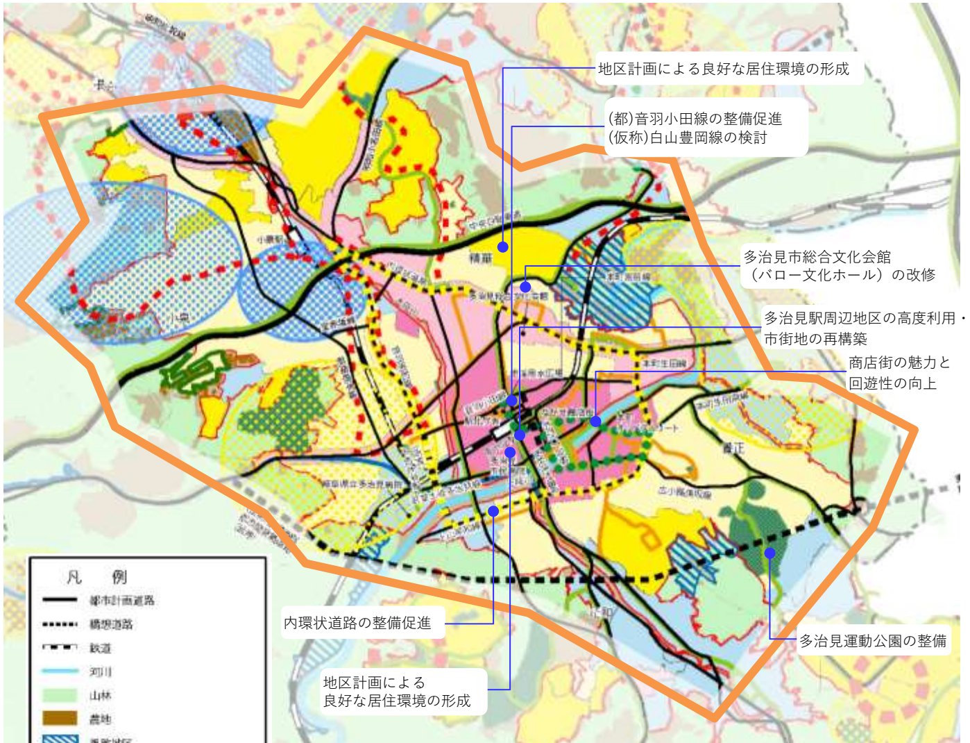
中央部市街地エリア 将来構想図