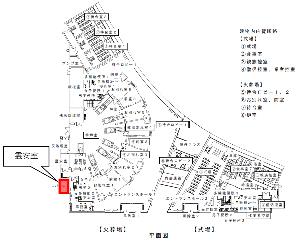
華立やすらぎの杜平面図