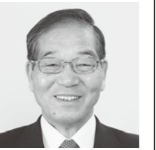
せんごく みきお 仙石三喜男

【市長】再度議案を提出する時期は未定である。新庁舎検討市民委員会の議論の進捗状況や、秋に開催予定の地区懇談会の状況を勘案し、判断する。