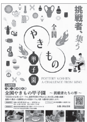
第1回やきもの甲子園のチラシ

「やくならマグカップも」をきっかけとしたコロナ終息後を見据えた陶磁器の魅力発信および人材発掘事業（第2回やくもの甲子園）に伴う委託料等を増額するものです。