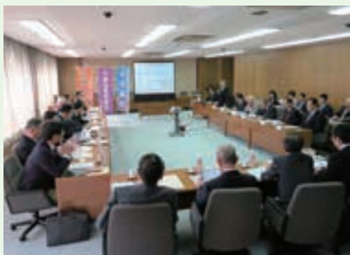
四日市市議会 視察の様子

平成28年度に議会として受け入れた行政視察は15件で、右記のとおりです。また、執行部へは、健全な財政に関する条例等について17件の視察がありました。