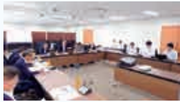
三田市での視察の様子

市内10カ所にある市民センターを最大限活用し、マイナンバーカードによるオンライン申請の拡大などデジタル化の推進と合わせて、市民サービスの向上と業務効率化にメリットのある「行かなくてよい市役所」の実現を目指しているが、市民に浸透させ利用を促す点については課題を残した様子であった。