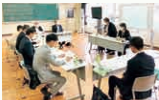
東京シュレ学園での視察の様子

●所感 「学びの多様化学校」である同校は、フリースクールから始まり、中学校を設立して15年になるが、不登校支援へのノウハウが集約されていると感じた。「安心して学び育つ学園」を目指す同校に子どもたちは安心して通っており、教師を「スタッフ」と呼ぶなど、生徒と教師の垣根がない。また、どんな学校にしたいか子どもたちに聞き、「No チャイム」「No 制服」「No 朝礼」「No 怒鳴り声」を実践している。ホームミーティングでは、どの子どもも生き生きと活発に意見を言っており、そこには学校に行きたくても行けず苦しんでいた姿はみじんも感じられなかった。彼らの下校と重なり、駅までの道を一緒に歩いたが、仲間と楽しく会話する姿は、本来の子どもの姿であると実感した。