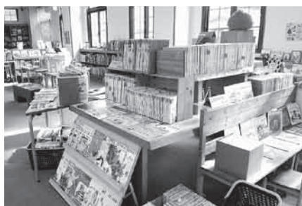
「子ども情報センター」施設内 多治見市役所本庁舎から徒歩2分

◆その他の質問項目 ◆坂上児童館の移転統合に伴う南坂上公園への遊具設置について ◆財政判断指標の基準値、目標値、財政向上指針の見直しについて