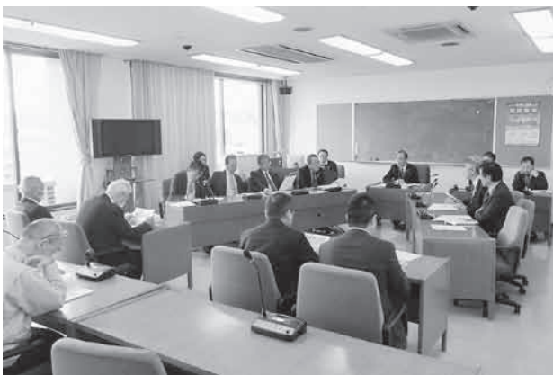
本庁舎建設に関する特別委員会第2小委員会