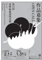
第13回 国際陶磁器展美濃 作品募集ポスター

国際陶磁器フェスティバルの開催について、本市も多数のイベントを開催する予定である。