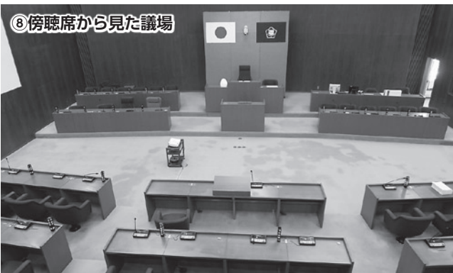
⑧ 傍聴席から見た議場

傍聴席から議場全体が一望できるようになっています。結構高さがあるって、足が少しすくんでしまいます。それでは、席に座って、多治見市議会を傍聴してください。