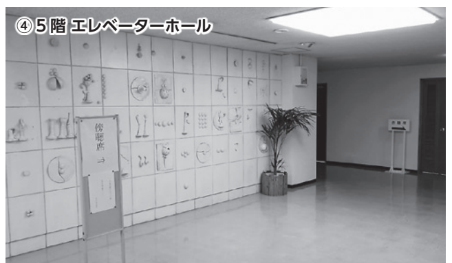
④ 5階エレベーターホール