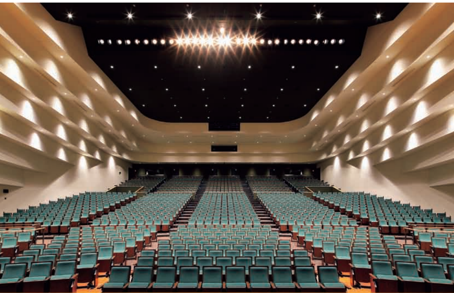
バロー文化ホール 大ホール