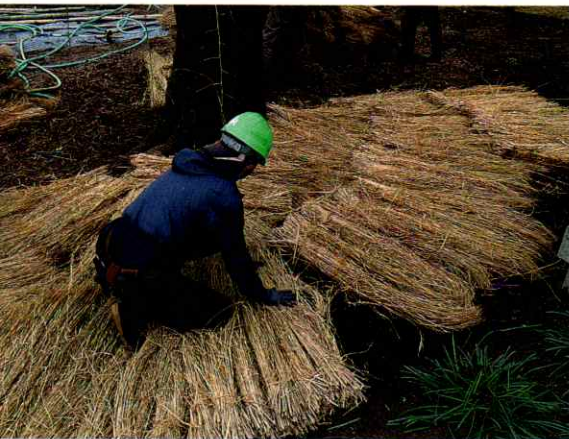
▲土壌の入れ替え後、ワラを敷き詰め土の乾燥を防ぐ様子

この事業によって樹勢が回復し、来年以降に花がきれいに咲き誇る様子を見られるのが楽しみです。