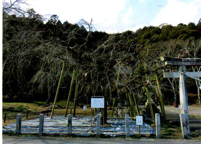
▲大藪のシダレザクラ

「大藪のシダレザクラ」は大藪町の神明神社境内にあります。昭和58年3月16日に多治見市天然記念物に指定されました。近年シダレザクラの樹勢が弱ってきており、市補助事業として平成30年度より3年計画で樹勢回復事業を行っています。今年度はその最後の年となりました。