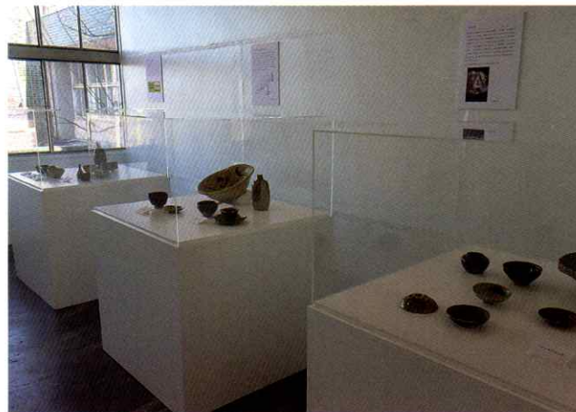
▶ 意匠研究所展示風景

多治見市モザイクタイルミュージアムと多治見市陶磁器意匠研究所との共同展示が、1月23日から3月26日まで美坂町の意匠研究所にて開催されました。室町時代後半に操業していた大窯である妙土窯の製品から、昭和時代のモザイクタイルにいたるまでの笠原で生産されたやきものを紹介しました。モザイクタイルの生産で有名な笠原のやきもの生産の歴史を学ぶことのできる展示となりました。