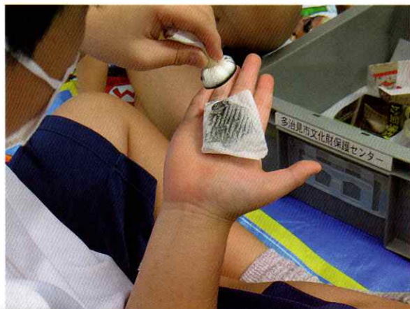
◀ 拓本体験(池田小学校6年生)

文化財保護センターでは、学校や喜多町西遺跡公園で昔の暮らしや地域の歴史に関する授業を行っています。今年度は小泉、池田、笠原小学校から授業の依頼がありました。校下の遺跡の説明や、火起こし、貫頭衣、石包丁の体験の他、拓本の体験もしました。拓本は土器や石などに刻まれた文字や文様を紙に写しとって記録し、調査するために使います。これらの体験を通して、子どもたちに地域の歴史や文化財についての理解を深めてもらっています。