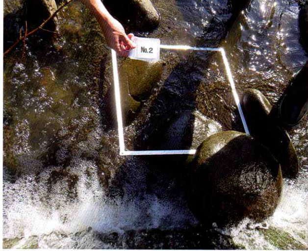
▲北小木川でのカワニナ調査の様子