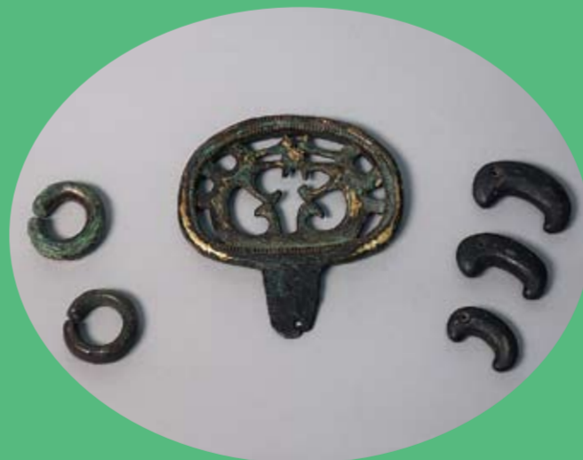
▲狐塚古墳出土品（複製）