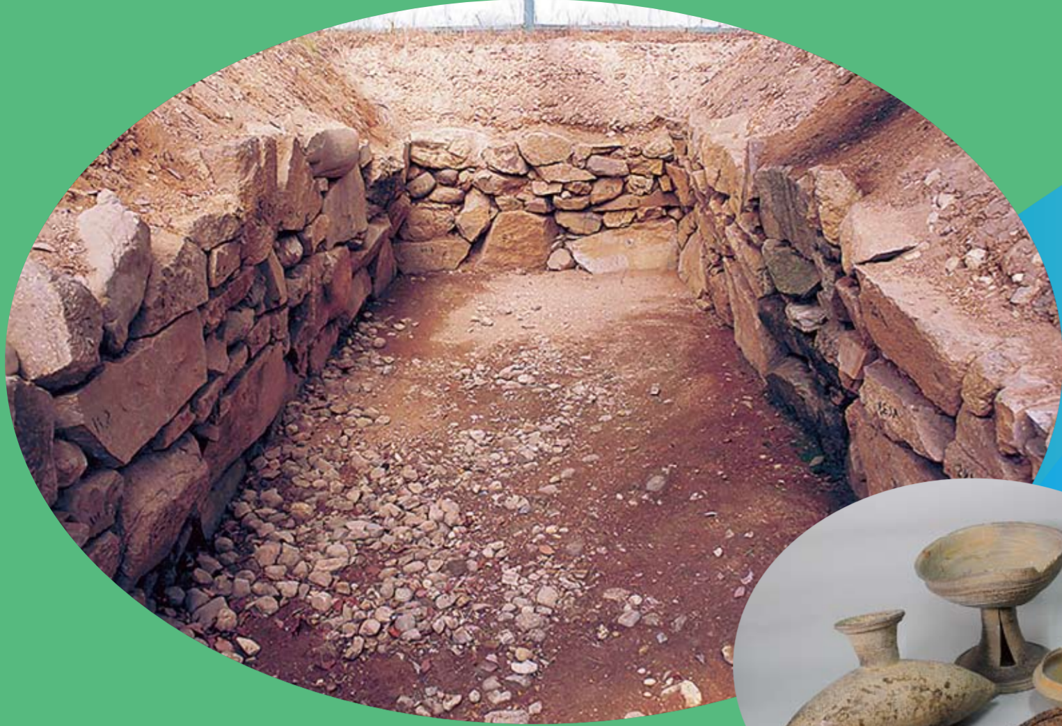
虎溪山一号古墳（石室）と出土品▲▶