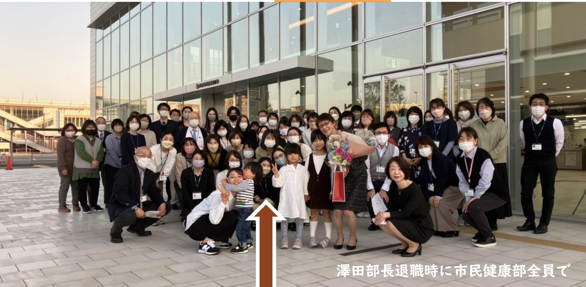
澤田部長退職時に市民健康部全員で