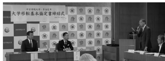
中京学院大学の本市移転一元化に係る基本協定書締結式（7/2）の様子

議会としましても、大学誘致については大変期待するとともに、市と大学がしっかりと連携して的確に事業が進むよう、しっかりと議論をして参ります。