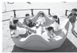
*座位の保てない子ども寝転んで遊べる。たくさんの子どもや大人も入れる。回転もゆっくりで安心。

【都市計画部長】設置する遊具のバリエーションについては、継続して情報収集に努める。親子そろって楽しめるワクワクするような公園づくりに努めていきたい。