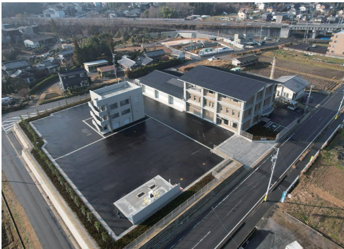
新築・移転した多治見市北消防署