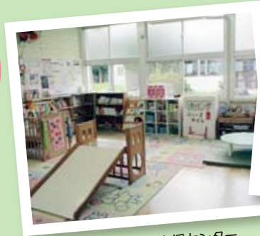
共栄地域子育て支援センター