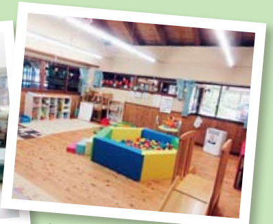
池田地域子育て支援センター