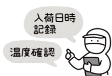
納入業者・食材の品質管理