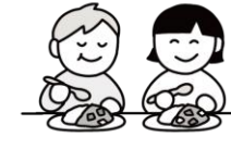
友達と一緒に食事を楽しむ