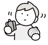
食べ物への興味・関心