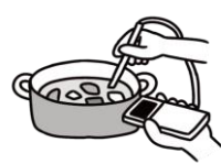
調理時の加熱の徹底(殺菌)