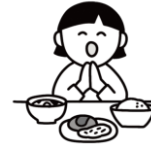
感謝の気持ちを育むマナー

給食の時間は、友達や先生と一緒に食べることで、協調性や社会性を育む大切な場です。「いただきます」「ごちそうさま」を通して、感謝の気持ちや食事のマナーを学びます。楽しい雰囲気の中で、食への興味を引き出し、自分で食べようとする意欲を伸ばします。