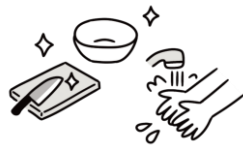
調理室での衛生管理