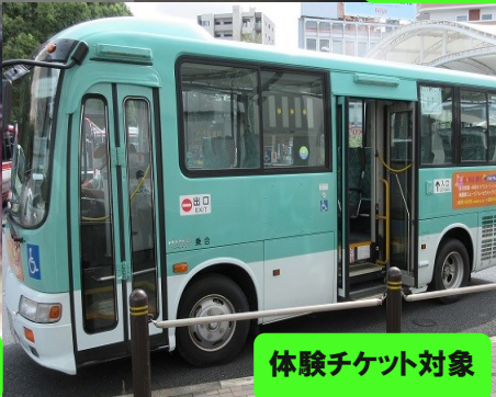
体験チケット対象