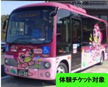
体験チケット対象