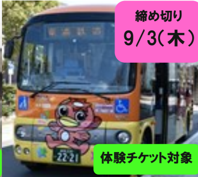
体験チケット対象