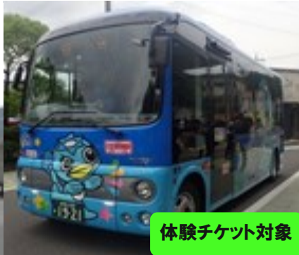
体験チケット対象