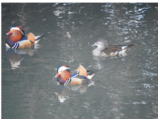
オシドリ

本市では、亜種と外来種を入れて 177 種の鳥類が確認されており、よく見かける種としては、トビ、ヒヨドリ、ホオジロ、スズメ、ハシボソガラス、ハシブトガラス等があげられます。サンコウチョウ、オオタカも市内で営巣が確認されています。また、土岐川は県下有数のオシドリ越冬地として、知られています。