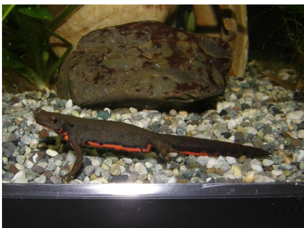
アカハライモリ

本市では、キツネやタヌキ、イタチ、ハクビシン、イノシシ、モグラの仲間、テングコウモリ等の希少種が生息しており、近年ではニホンカモシカも確認されています。爬虫類ではニホンヤモリ、ニホンイシガメ、トカゲ、マムシ等が、両生類ではアカハライモリ、トノサマガエルが確認されています。外来生物も多く、日本固有種との交雑、食物や成育場所の競合、新たな感染症の発生等が懸念されています。