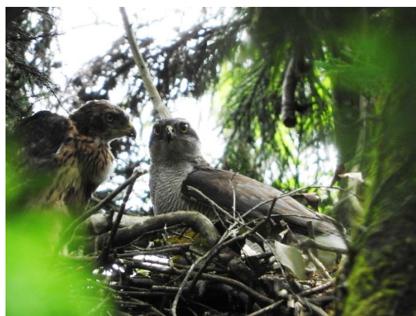
オオタカ