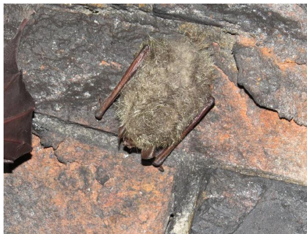
テングコウモリ