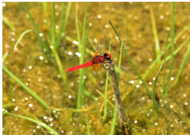
ハッチョウトンボ